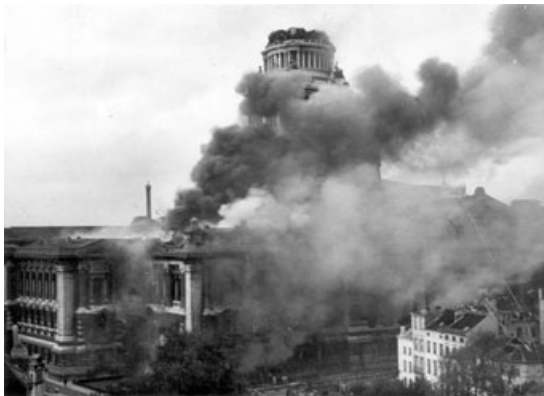
Feu à la coupole du Palais de Justice où se trouvent une série de documents à détruire au plus vite.

A l'arrivée des Alliés, les Allemands en fuite mettent le