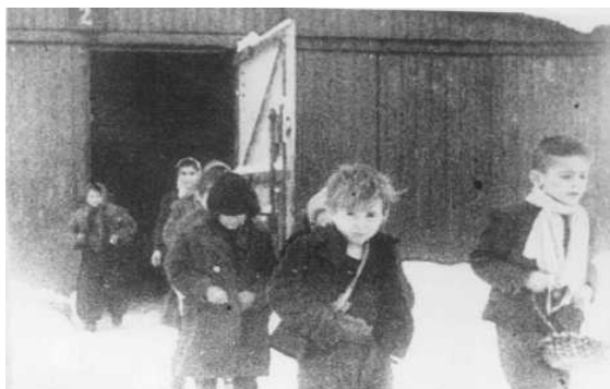
En 1945, les soldats alliés trouvèrent, dans les camps, également des milliers de survivants- juifs et non-juifs- souffrant de famine et de maladies, dont des enfants.