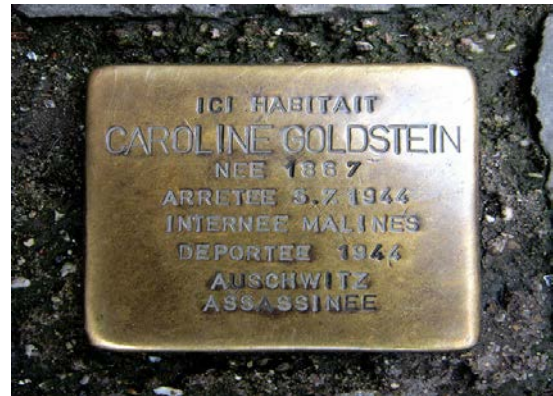
« pavés de mémoire ». Ce concept consiste à placer un pavé commémoratif devant le dernier domicile des victimes juives. A voir "Rue Matrognard" à LIEGE.

Un témoignage en mémoire des juifs de la Shoah: les