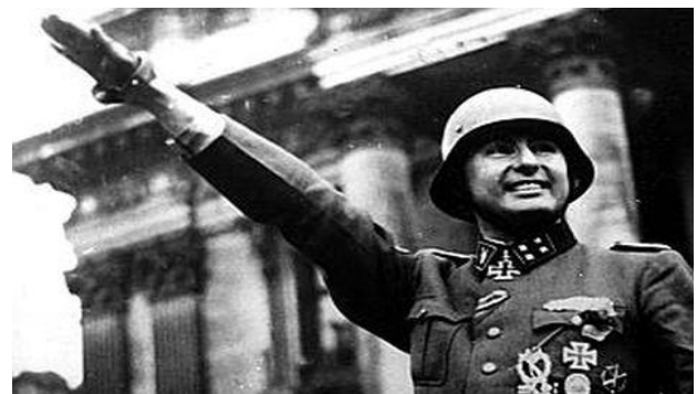
A enseigner aussi, surtout aujourd'hui: Léon DEGRELLE, fondateur du mouvement REX, resté fidèle à Hitler jusqu'à son dernier souffle. On doit continuer à en parler !